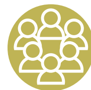
Groepsgrootte 2 t/m 10 pers.