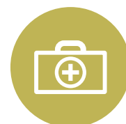
Verzorgingsgraad A t/m H