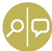
Diagnostiek of behandeling